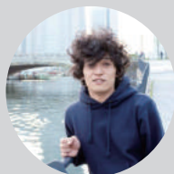
加藤甫 KATO Hajime 記録 / 写真家

1987年神戸市生まれ。2012年横浜国立大学大学院／建築都市スクールY-GSA卒業。DESIGNTIDE TOKYO2012事務局を経て、2013年飯田善彦建築工房に入社。建築設計事務所に所属しながら、併設されている建築系ブックカフェ「Archiship Library&Café」の企画・運営を一手に担う。様々なイベントのコーディネーターや出版・編集業務を通じて建築とそのまわりをつなぐ活動を始め、退社後の2016年よりフリーランスとして建築家の携わるイベントやプロジェクトの企画・運営・広報を行なっている。