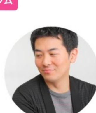
中野成樹 舞台演出家 東京 know more >